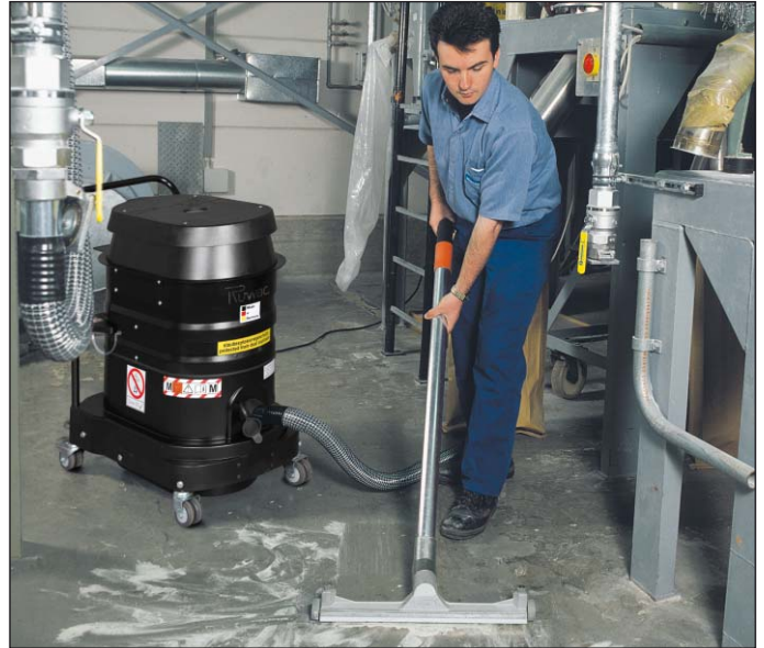
WS 2220, zona 22, en la industria química