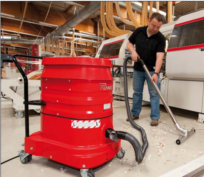
WSZ 2320 en la limpieza de suelos