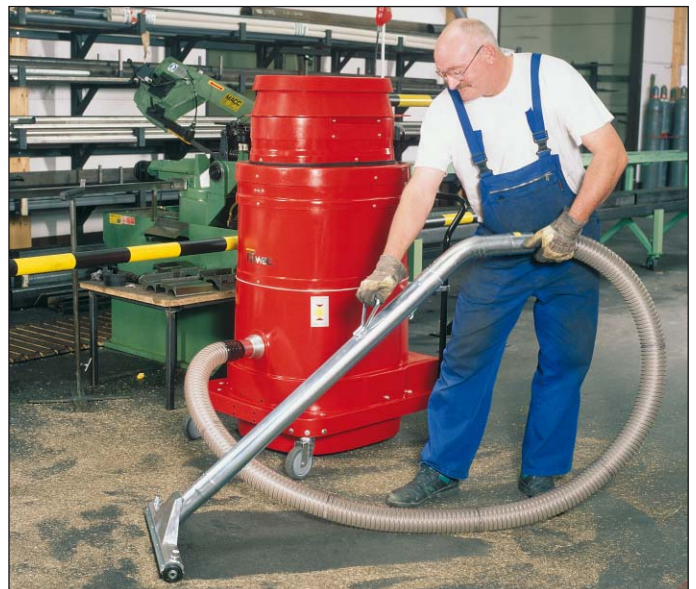
WS 3320, limpieza del suelo, en la industria del metal