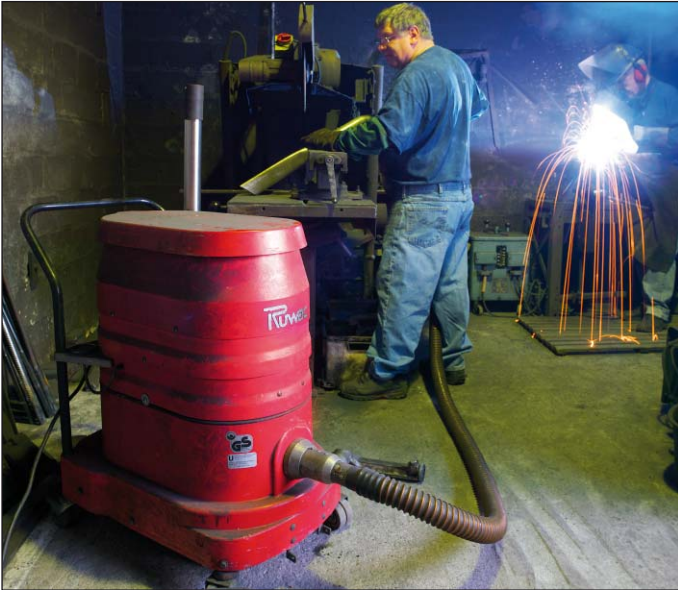
WS 2210 en el procesamiento de metales