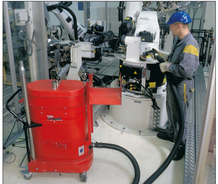
WS 2210 en la limpieza de máquinas