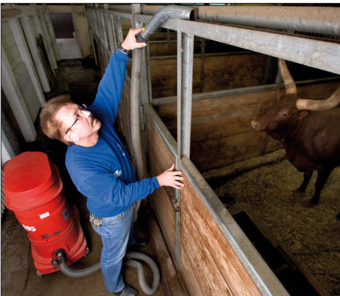
WS 2310, aspiración de suciedad en un zoo